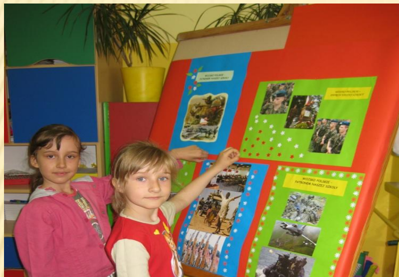
Nasze gazetki o patronie szkoły